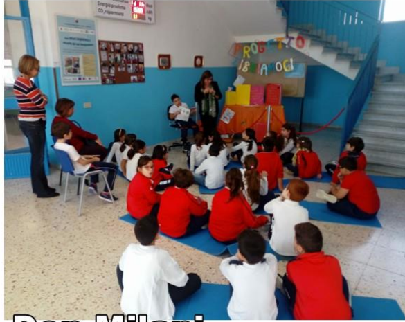
Quarta A - Don Milani