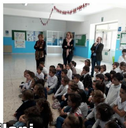
Quinte A-B Don Milani