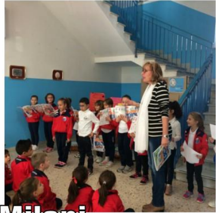
Classe 2A Plesso Don Milani