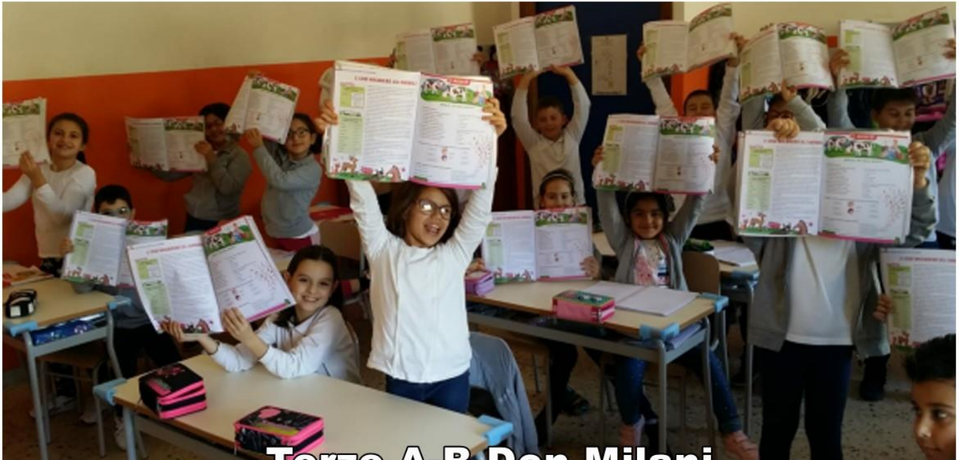
Terze A-B Don Milani